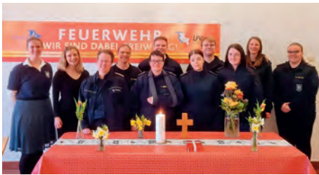
Wir sind auch dabei, wenn die Kirche zu uns kommt.

Am 8. März haben wir anlässlich des Weltfrauentages einen gut besuchten Infonachmittag speziell von Frauen für Frauen im Feuerwehrhaus gestaltet. Einen Tag später ging es für einen intensiven Ausbildungstag mit der halben Wehr und allen drei Fahrzeugen auf das Trainingsgelände der Landesfeuerwehrschule nach Harsiesee. Am 17.03. wurde unser Feuerwehrhaus zur Unterkunft der Kirchengemeinde Wasbek, um einen Gottesdienst in den Mauern der Feuerwehr abzuhalten.