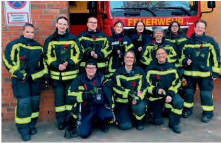
Unsere Powerfrauen am Weltfrauentag

Am 8. März haben wir anlässlich des Weltfrauentages einen gut besuchten Infonachmittag speziell von Frauen für Frauen im Feuerwehrhaus gestaltet. Einen Tag später ging es für einen intensiven Ausbildungstag mit der halben Wehr und allen drei Fahrzeugen auf das Trainingsgelände der Landesfeuerwehrschule nach Harsiesee. Am 17.03. wurde unser Feuerwehrhaus zur Unterkunft der Kirchengemeinde Wasbek, um einen Gottesdienst in den Mauern der Feuerwehr abzuhalten.