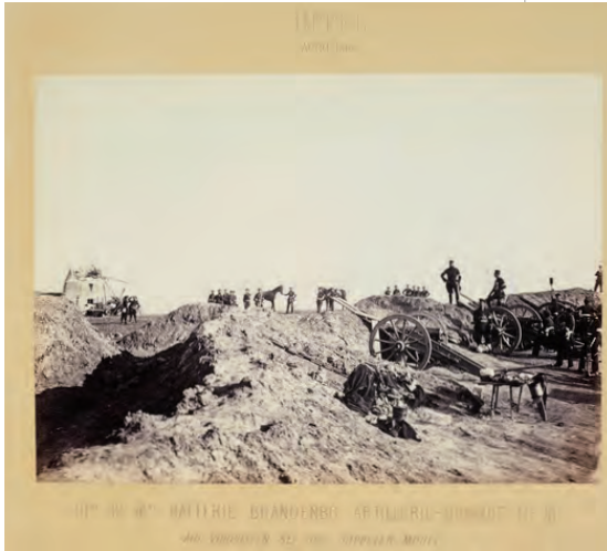
„Düppeler Schanzen“

18.04.1864 von den Preußen erstürmt wurden. Im Wiener Frieden musste Dänemark die Herzogtümer Schleswig und Holstein an die beiden Großmächte abtreten. Gemeinsam regierten Preußen und Österreich dann bis 1866 und es kam, wie es kommen musste: der Streit um die Verwaltung führte 1866 zum Deutschen Krieg zwischen Preußen und Österreich und ihren jeweiligen Verbündeten. Die Entscheidung fiel am 03.07.1866 in der Schlacht bei Königgrätz in Böhmen, die mit einem entscheidenden Sieg Preußens endete.