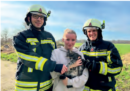
Unser 1. Einsatz 2024 – Katze wie im Kinderbuch gerettet

24 Stunden am Tag und 7 Tage die Woche sind die Kameraden der Freiwilligen Feuerwehr Padenstedt bereit, den Bürgern unseres Dorfes in einem Notfall zu helfen. In der ersten Jahreshälfte wurden wir bisher sechs Mal über den Notruf 112 alarmiert. Zudem reichen wir noch vier Einsätze aus Dezember 2023 nach. Auffällig in der Liste sind viele Feuer. Zudem wurden wir am 31.12.23 und 14.04.2024 jeweils zu zwei Einsätzen an einem Tag gerufen.