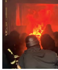
Heiße Grenzerfahrung bei der Realbrandausbildung

Wir sind gespannt auf die weiteren Herausforderungen der 2. Jahreshälfte. Diverse Lehrgänge und Dienste sind geplant. Wir